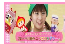
エプロン シアター