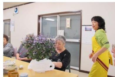
お誕生日のプレゼントは？

歌あり、お話あり、笑いありの楽しい15分間でした。「みなまからお声がかかれば何処へでも…。」と張り切っておられました。ありがとう「いろはに座」の皆さん。