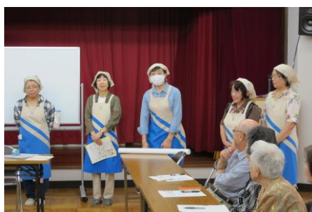
食生活改善推進協議会の皆さん

食塩の摂りすぎは、高血圧や血管障害のため脳出血、脳梗塞、腎臓障害など様々な病気を引き起こします。 日本では、今年から1日あたりのナトリウム摂取量を、男性は8g未満、女性は7g未満に引き下げられました。 生活習慣病でもある高血圧の人は4300万人もいるといわれています。 毎日の食生活で、減塩を心がけ、万病のもと高血圧や糖尿病を防止することがこの講座の目的です。