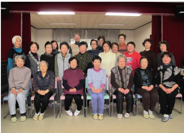
思い出多い中央集会所で記念写真

12月16日 ステーションパーク中央集会所にて、10年間続いたひばりの会のお別れ会が開かれました。手芸を得意とする会員が多いことから布切れや古新聞を使って、生活に便利な日用品を作りました。