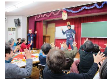
みんな一緒に脳トレ体操

さっそく健康・脳トレ体操を30分ほどして、頭も体もリフレッシュ！心も体も暖かくなったところで、クリスマスの歌とお正月のうたを何曲も歌ってからお楽しみのクリスマスケーキをいただきました。