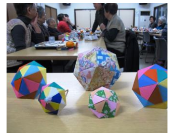
最後の折り紙は「日傘」