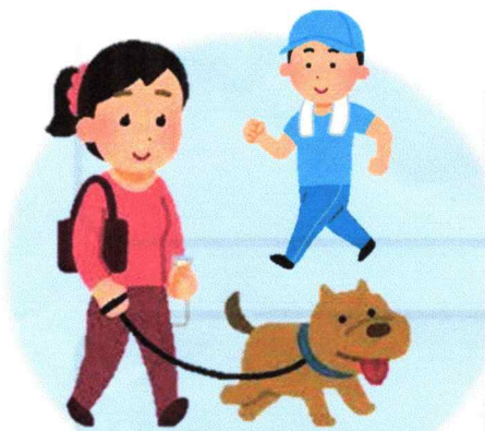
ウォーキング、散歩し“ながら”

見守りの中には、日頃の何気ない気づきによって、通報につながる場合があります。皆さんも、自分の生活をおくり”ながら”気になったことは相談するようにしましょう。