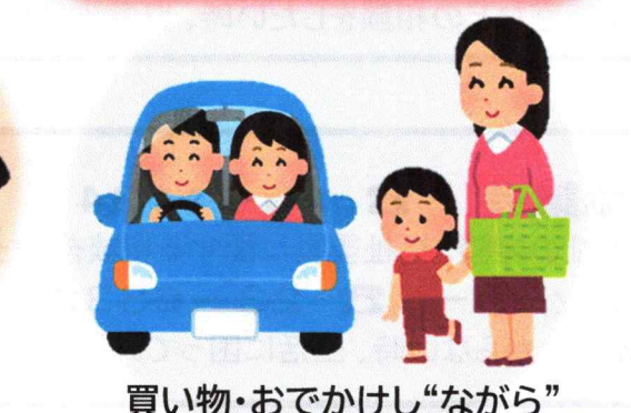
買い物・おでかけし“ながら”