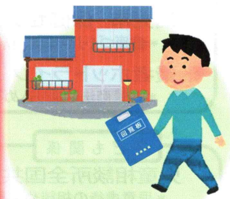
回覧板をまわし“ながら”