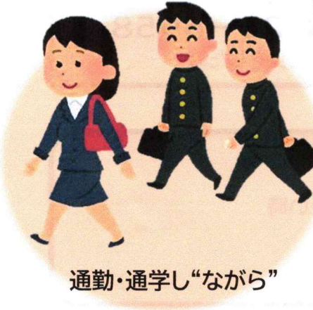
通勤・通学し“ながら”