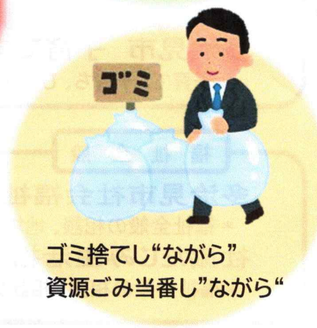
ゴミ捨てし“ながら” 資源ごみ当番し“ながら”